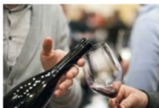
Slovenski festival vin poteka vsako leto predzadnji konec tedna v novembru.