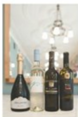
Najvišje ocenjena vina letošnjega Festivalnega ocenjevanja.