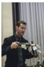
Večina vinarjev, ki se predstavljajo na festivalu, je slovenskih, v zgornji dvorani pa se mednje pomešala tudi kak tuji vinar, predvsem iz sosednjih držav.