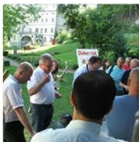
Tečaj Mojstrska govedina na žaru