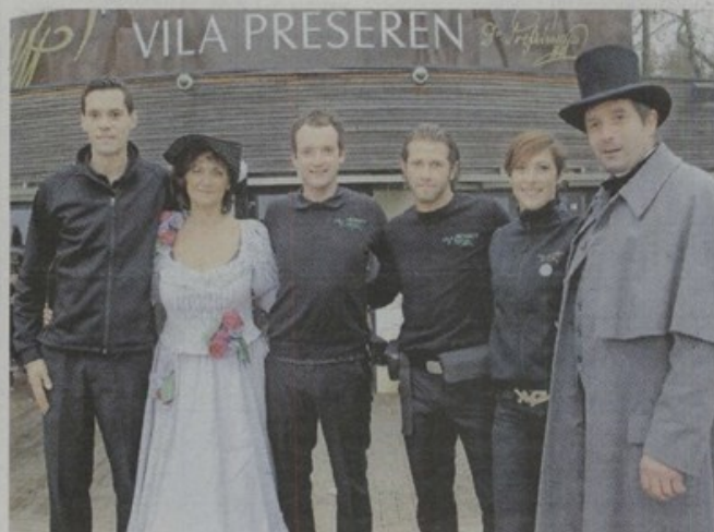
'Blejski' France Prešern in njegova Julija z zaposlenimi Prešernove vile na Bledu; na obisk dogodka tudi tokrat vreme ni imelo večjega vpliva.