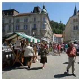
Slike s časovnice